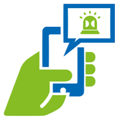
Omainen / Hoitaja