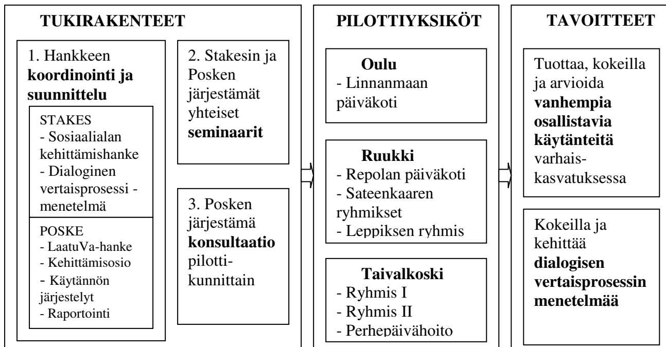
Kuvio 1. Vanhempien osallisuuden vahvistaminen –pilottihanke vuonna 2005