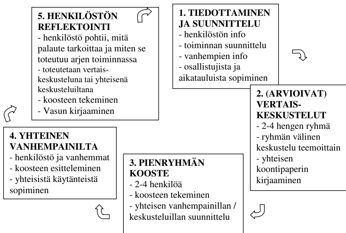
Kuvio 3. Dialoginen vertaisprosessi