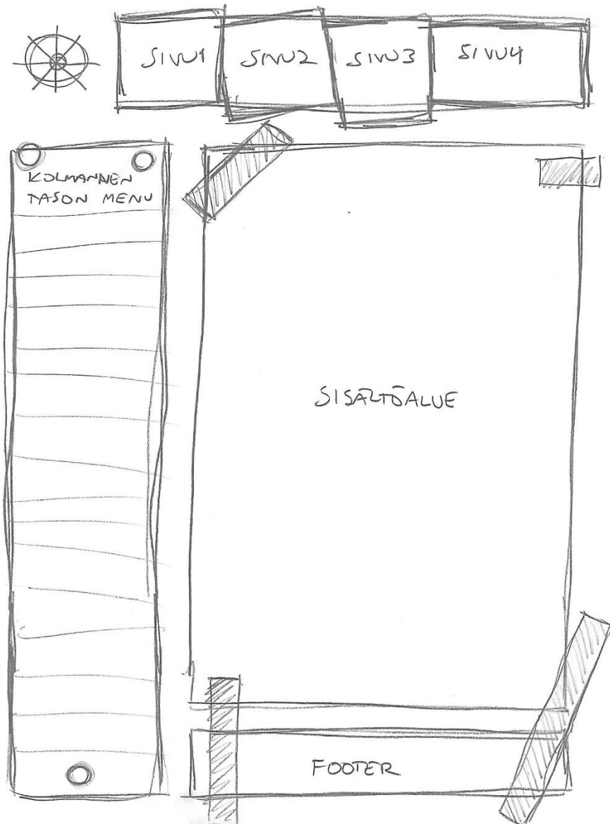
Kuva 2 Alasivun hahmotelma