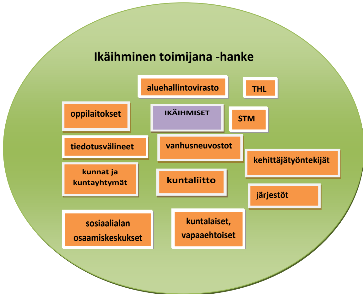
Kuvio 3 Viestinnän sidosryhmät

Sekä ulkoista että sisäistä viestintäsuunnitelmaa tarkistetaan ja päivitetään säännöllisesti (Liitteet 7 ja 8).