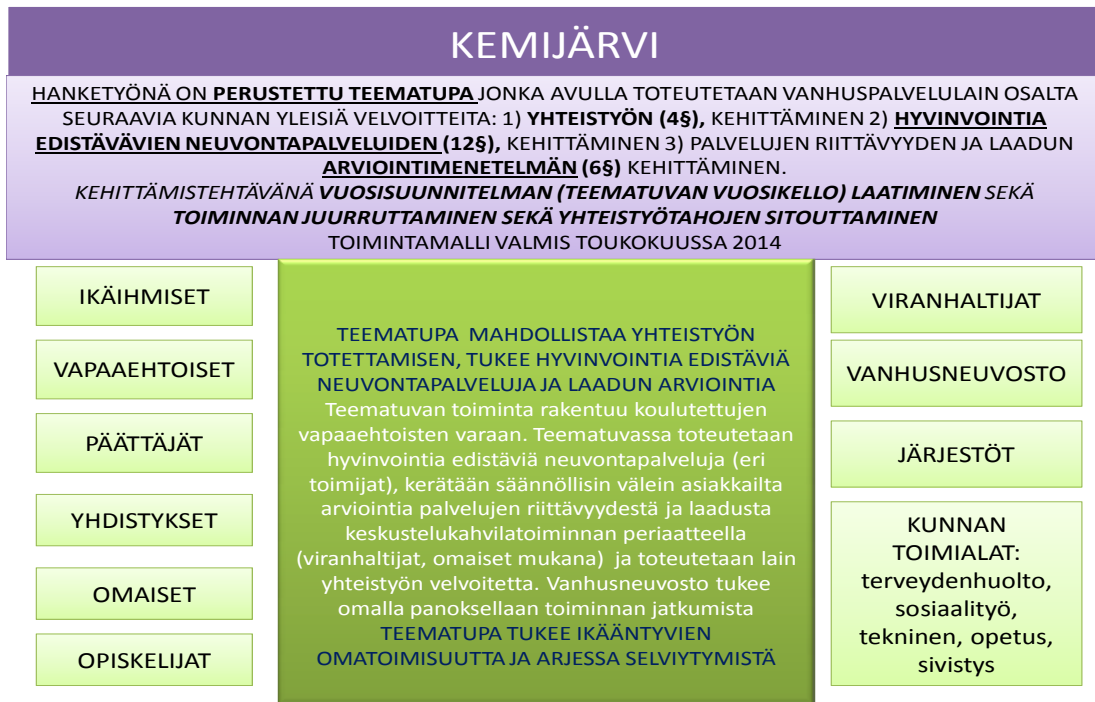
Kuvio 1. Kemijärven kaupungin kehittämistavoite ja -tehtävä